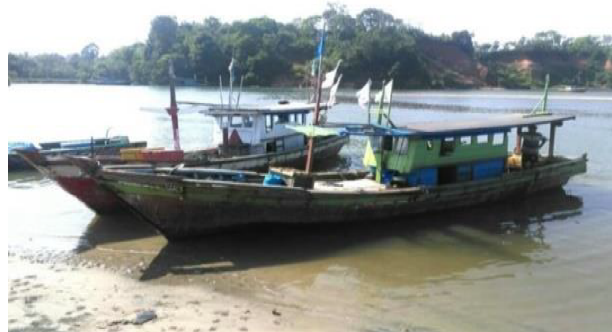
Gambar 3. Kapal Motor 5 GT di Desa Pasar Bantal, Kecamatan Terawang Jaya, Kabupaten Mukomuko, Provinsi Bengkulu (Foto dokumentasi penelitian, 2019).

Sarana dan prasarana produksi perikanan tangkap terdiri dari armada penangkapan ikan dan alat tangkap ikan. Jenis armada yang banyak digunakan nelayan di PPI Desa Pasar Bantal didominasi oleh kapal motor ukuran 5 GT ( Gross Tonnage ) sebanyak 149 kapal dengan mesin dompeng. Alat penangkapan ikan (API) yang digunakan oleh nelayan, yaitu pukat udang (mini trawl) dan alat tangkap sampingan (musiman) yaitu jaring insang milenium dan pancing rawai.