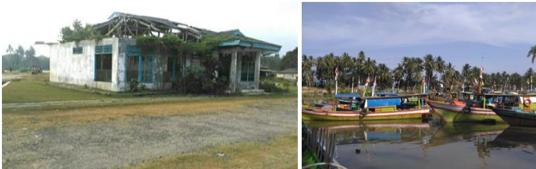
Gambar 2. Pangkalan Pendaratan Ikan (PPI) di Desa Pasar Bantal, Kecamatan Terawang Jaya, Kabupaten Mukomuko, Provinsi Bengkulu (Foto dokumentasi penelitian, 2019).

Penduduk Desa Pasar Bantal yang bermata pencahariannya sebagai nelayan tercatat ± 400 orang. Unit penangkapan ikan yang ada terdiri dari kapal motor 149 unit dan perahu motor tempel 40 unit. Fasilitas utama pendukung kegiatan perikanan tangkap di Desa Pasar Bantal, adalah PPI yang dibangun tahun 1998-2000 dengan luas area ± 1,8 ha dan memiliki beberapa fasilitas pokok berupa fasilitas fungsional dan fasilitas penunjang. Namun saat ini semua fasilitas tersebut saat ini dalam kondisi rusak.