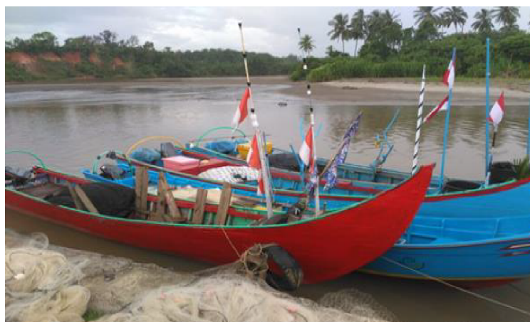
Gambar 4. Perahu Motor Tempel (PTM) PPI Desa Pasar Bantal, Kecamatan Teramang Jaya, Kabupaten Mukomuko, Provinsi Bengkulu.

Ada 40 unit Perahu Motor Tempel (PMT) dengan mesin Yamaha 40 PK yang dipergunakan nelayan untuk melakukan operasi penangkapan ikan. Sebanyak 30 unit PMT menggunakan alat penangkapan ikan yang utama yaitu pukot lore dan alat tangkap sampingan (musiman) yaitu jaring insang milenium. Daerah penangkapan ikan yaitu Pantai Abrasi Mukomuko dan Muara Sungai Air Hitam, yang berjarak \pm 2 mil dengan 5-6 nelayan. Unit PMT lainnya menggunakan 2 mesin Yamaha 40 PK dengan alat tangkap pukot payang, yang melakukan operasi penangkapan ikan di Pantai Abrasi Kota Mukomuko dan Muara Air Hitam, sejauh \pm 3 mil dengan jumlah nelayan 10-12 orang.